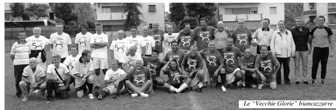
Le "Vecchie Glorie" biancazzurre