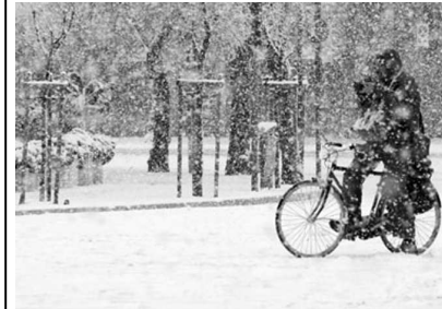
Foto vincitrice sezione bianco-nero