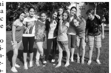
Ragazzi in posa all'Amalfy Party