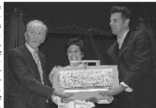
Due momenti della serata di premiazione