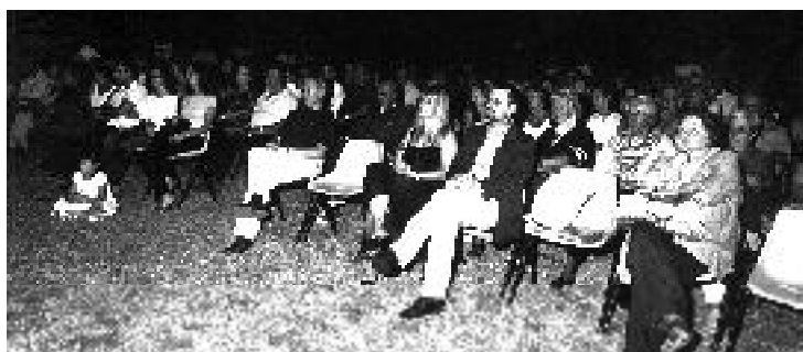
Settembre 2005 - Serata, organizzata in collaborazione con "La Sciabica", dedicata al poeta U. Piersanti candidato al Premio Nobel per la letteratura