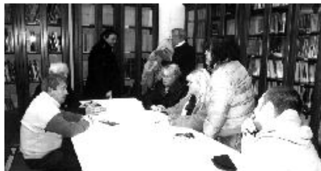
13-12-2006: Assemblea del Direttivo della Biblioteca Luca Orciari