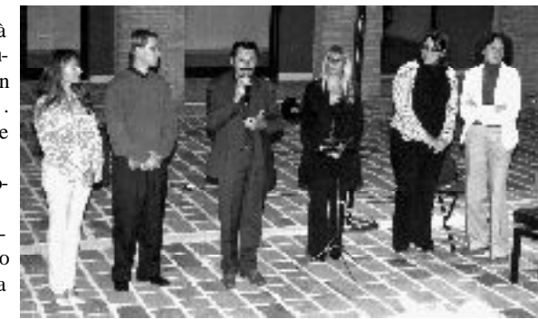
2006 - Pittura, poesia e musica