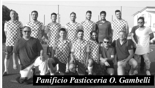
Panificio Pasticceria O. Gambelli