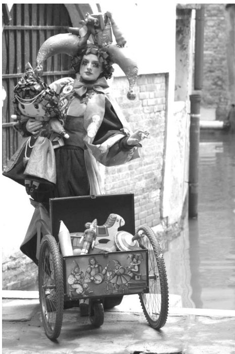
Anna in “La ricerca del tempo perduto” - 2013

La prima partecipazione al Carnevale di Venezia risale ormai