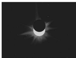
(nell'immagine simulazione dell'Eclisse Parziale di Sole)

Mostra fotografica d'immagini celesti realizzate dai soci della N.A.S.A. con esclusiva esposizione di meteoriti